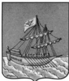
Герб г. Костромы 1767 г.